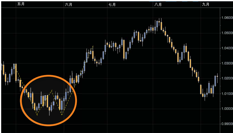
图4 交易形态的初期

与许多形态一样，W形也可用于做多和做空交易。以下的所有例子都是反之亦然，您可在相反的最初形态中进行相反的交易，具体取决于您最初看到的是涨势还是跌势。