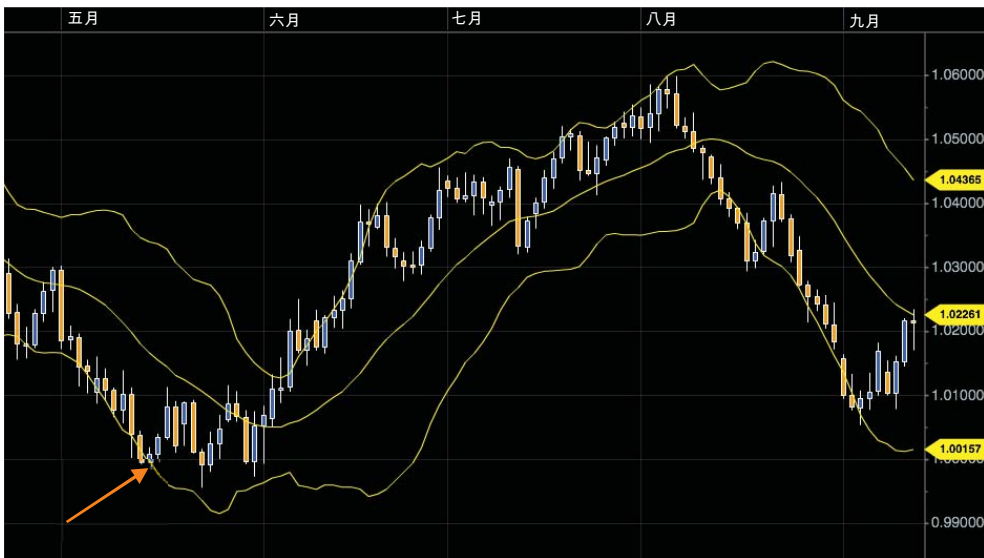
图5 将形态与布林线一起显示

图4中的圆圈部分突出显示了W形态。在这个趋势中，首先是探底，之后是短期反弹，接着是重新探底，这就构成了我们讨论的这个形态。右边的低点可以高于、等于或低于先前的低点。在下一张图中，我们会看到同样的形态，但是会加入布林线图，因为这样我们能衡量价格走势的极端程度。