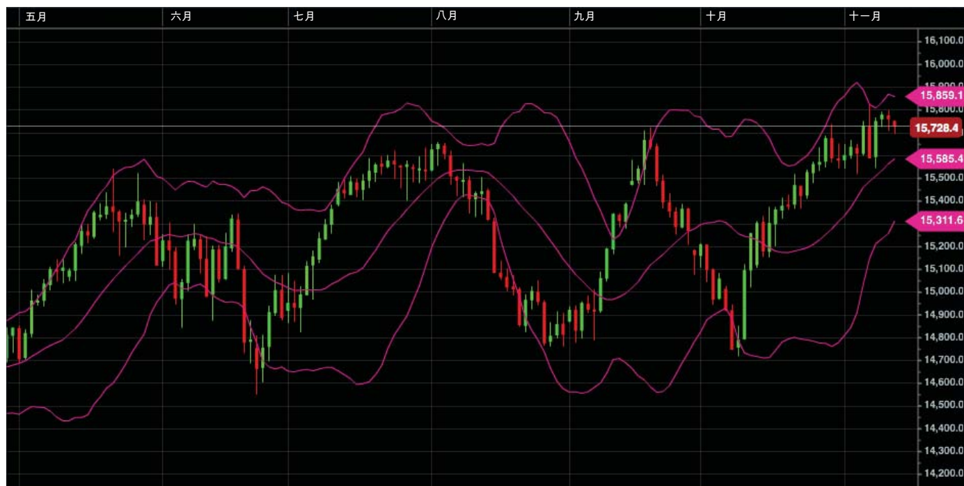
图2 布林线根据变化的市场条件调整

布林线由三根围绕价格波动的曲线表示。中轨是20期移动平均值，这是中轨的默认值。上轨是移动平均值加两个标准差，而下轨是移动平均值减2个标准差。您会看到上轨和下轨之间的地带在大多数时间覆盖了