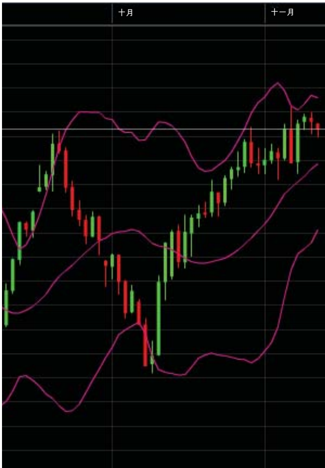
图3 价格突破布林线是重大的统计事件。

图3更深入地展现了图2中的一个组成部分。您会看到，当价格开始快速波动时，它跳出了布林线的界限。布林线的方向和宽度也据此快速调整。