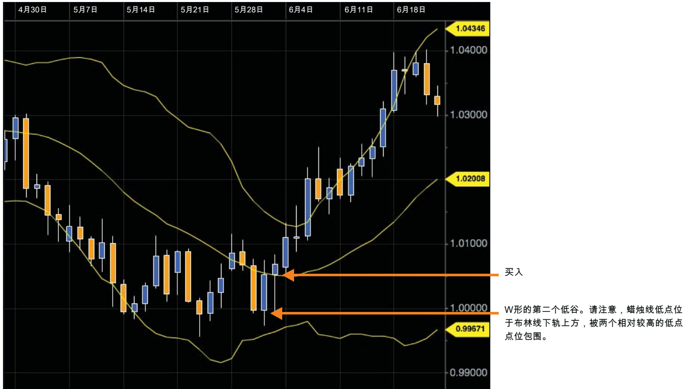
图6 第二个低谷的形成是关键信号。

一旦形态中出现第二个低谷（见图6），那么您可以入场建仓。当金融产品的交易价格高于最低点所在蜡烛的最高点（即低谷中的最低点），