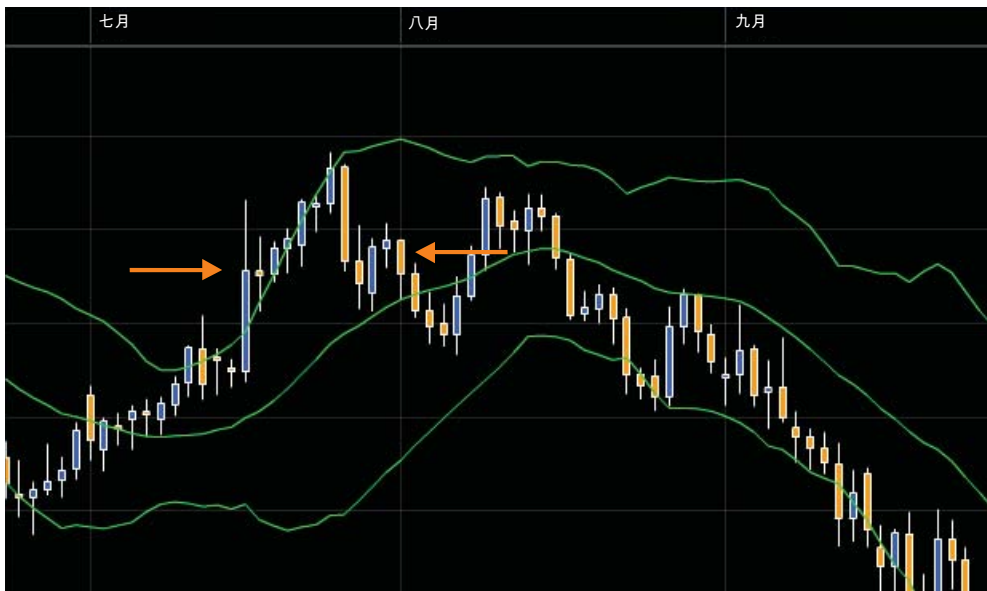
图7 这个形态的逆转是很好的做空机会。

那么这表示低谷已经形成。这时，您应当等待当前交易价格的形态在此位置固定后，再确认W形态的形成，之后再进场交易。